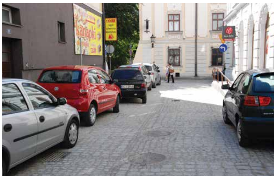
W śródmieściu Cieszyna na niektórych ulicach trwają prace odtworzeniowe kostki brukowej.