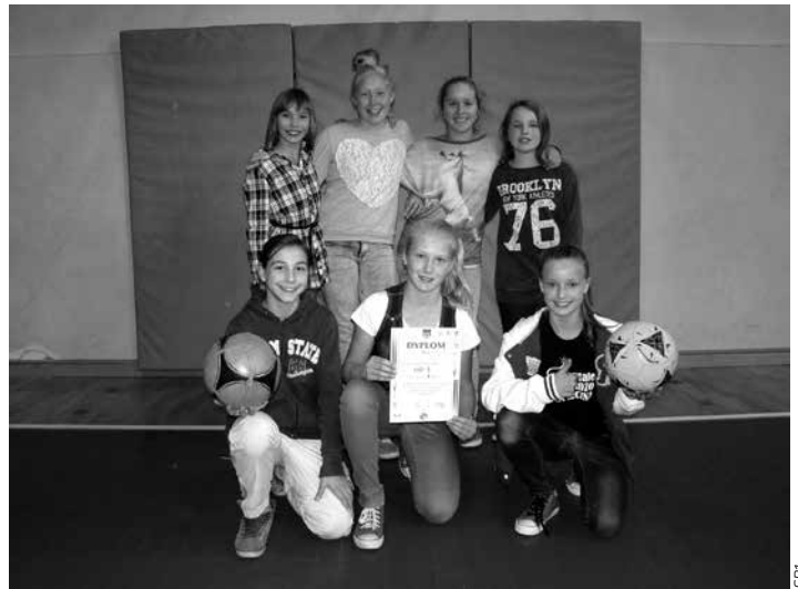
...i minipiłce nożnej.