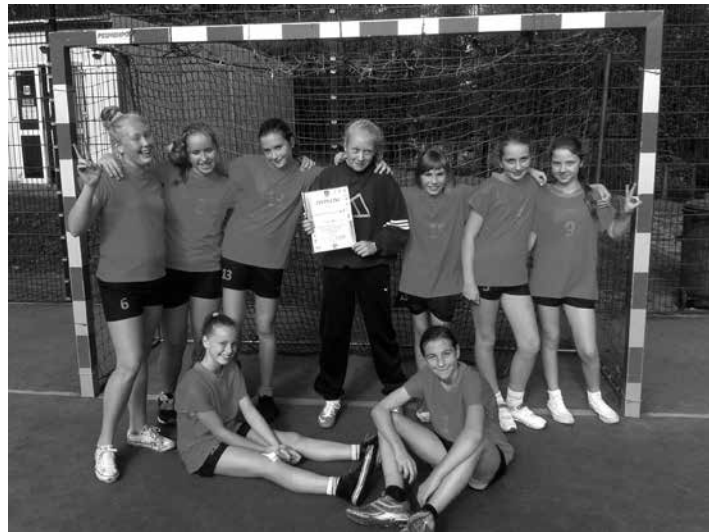
Reprezentacja SP1 w minipiłce ręcznej...