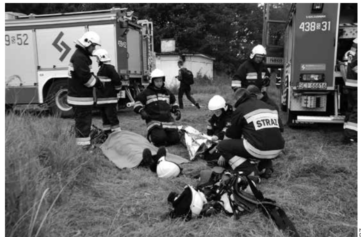
Ćwiczenia w Cieszynie.

Podczas uroczystości odbył się przejazd samochodów, zakupionych w ramach projektu „Strażacy bez granic” (otrzymały je OSP Markłowice, OSP Bobrek, OSP Chotěbuz, OSP Zpupná Lhota – Podobora), trasą do Kocobędza i Czeskiego Cieszyna, tak aby również