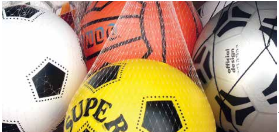
Cieszyniaci najwięcej punktów przyznali Ministerstwu Sportu i Rekreacji, która zakłada wybudowanie przy ul. Skrajnej boiska, placu zabaw i siłowni pod chmurką.

Decyzją większości głosów w przyszłym roku w Cieszynie powstanie minirefekt sportu i rekreacji na osiedlu Piastowskim przy ul. Skrajnej. Projekt ten zdobył największą ilość punktów – 5798. W sąsiedztwie Przedszkola nr 19 mają zostać wybudowane boiska do piłki nożnej, plażowej, a także kącik wypoczynkowy i plac zabaw dla dzieci, będzie można również poćwiczyć na świeżym powietrzu na urządzeniach sportowych. Przewidywany koszt realizacji przedsięwzięcia to 292 700 zł.