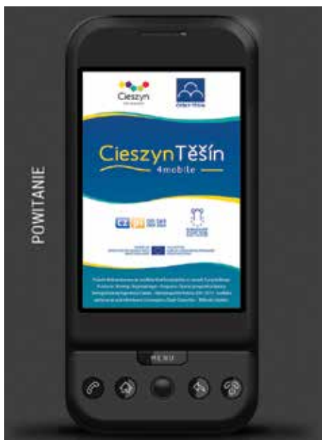
Cieszyn i Czeski Cieszyn wspólnie stworzyły przewodnik turystyczny na smartfony...