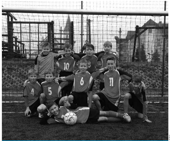
Drużyna piłkarska z SP3.