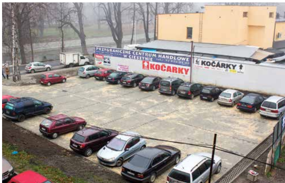
Na rogu al. Łyska i ul. Schodowej powstał utwardzony kostką parking. Pojawią się kolejne.