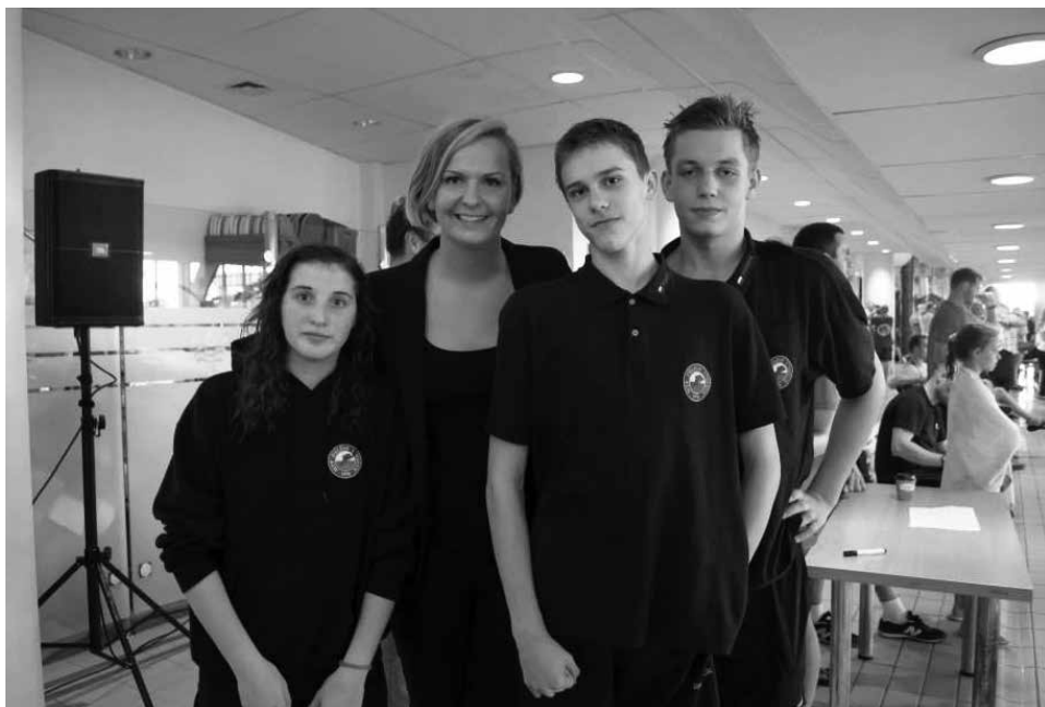
Pamiętkowe zdjęcie zawodników „Delfina” z mistrzynią olimpijską Otylią Jędrzejczak.