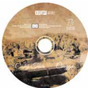
...oraz film promocyjny.