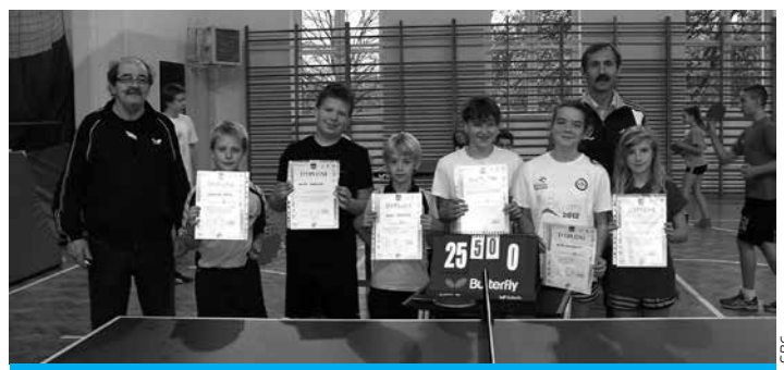
Drużyna z SP6 – najlepsza w tenisie stołowym wśród cieszyńskich podstawówek.