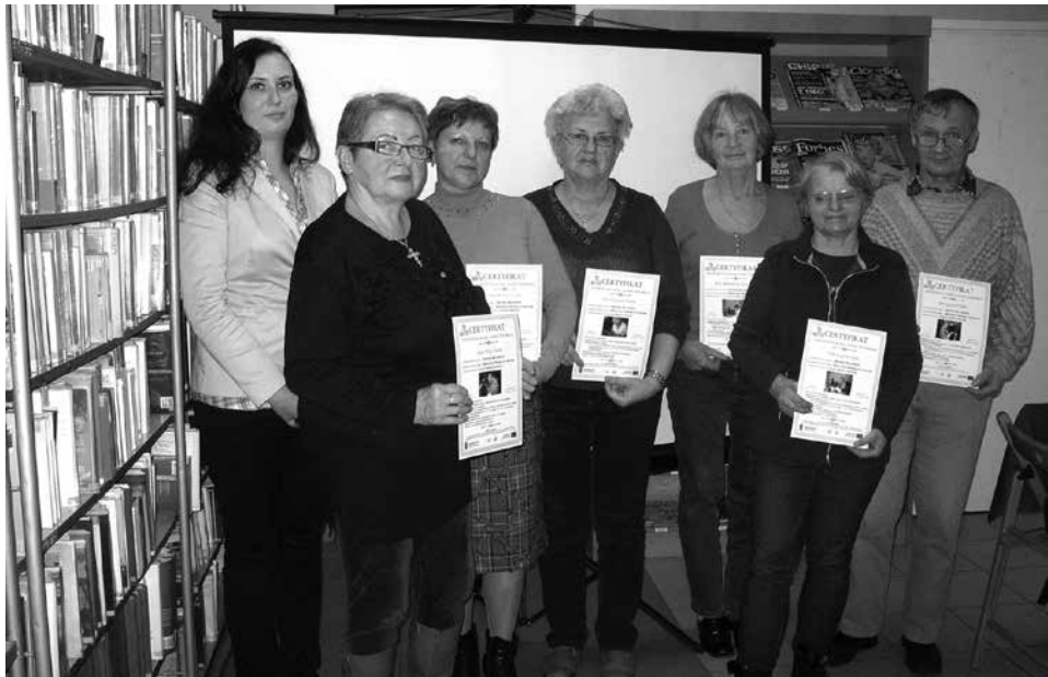
Zadowoleni uczestnicy zajęć komputerowych wraz z prowadzącą.