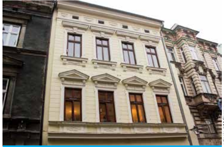
Odnowiona elewacja kamienicy na ul. Głębokiej.