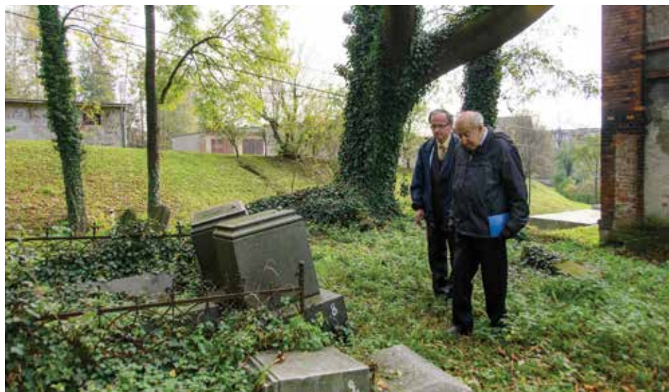
Wizyta w Cieszynie była okazją dla profesora do odwiedzenia starego cmentarza żydowskiego.