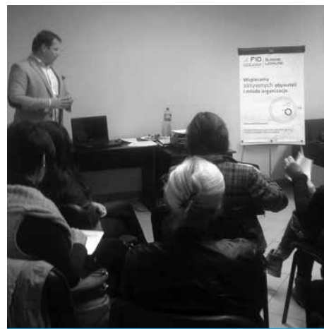
Szkolenie członkiń klubu soroptymistek.