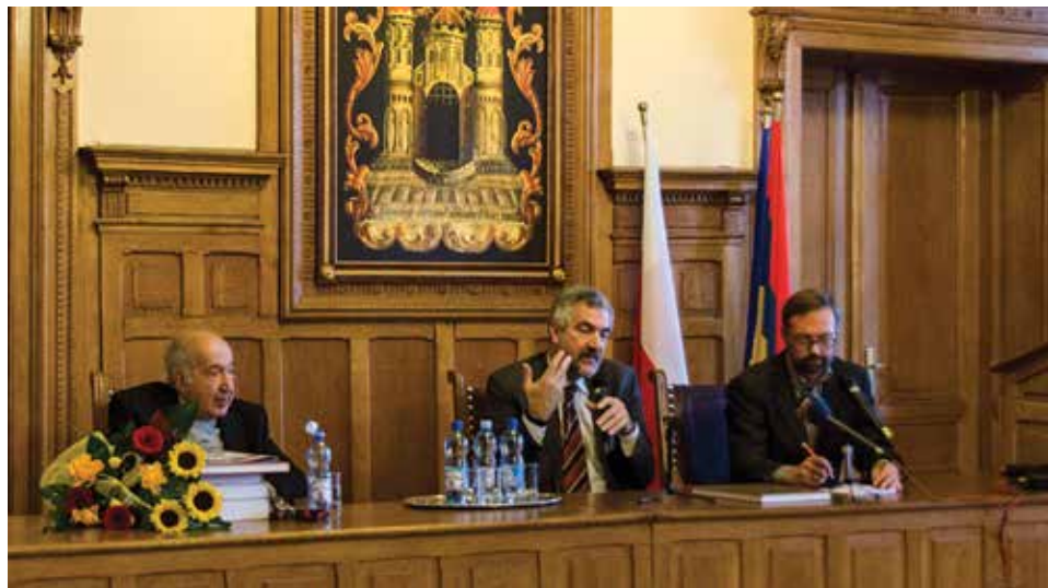
Razem z prof. Pipesem do Cieszyna przyjechał jego syn – historyk dr Daniel Pipes (w środku).