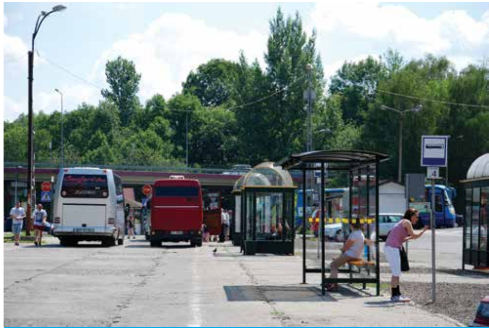
W kwietniu przyszłego roku poznamy finalny projekt węzła przesiadkowego przy ul. Hajduka.

Docelowy projekt zagospodarowania nieruchomości przy ul. Hajduka, które w niedalekiej przyszłości będą pełnić funkcję dworca autobusowo-kolejowego wraz z niezbędną infrastrukturą towarzyszącą, poznamy w kwietniu 2015 roku. Projekt obejmować będzie m.in.: gruntowny remont i modernizację zabytkowego budynku dworca kolejowego, budowę przeszklonego pawilonu z funkcją poczekalni, co najmniej 6 zadaszonych miejsc przystankowych, miejsc postojowych dla taksówek,