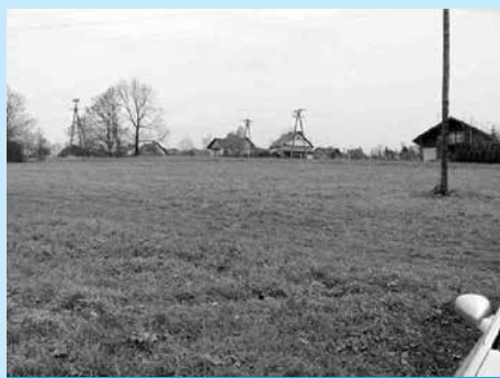
Do kupienia są dwie działki w rejonie ul. Jastrzębiej.

Szczegółowe ogłoszenie o przetargu zostało zamieszczone na stronie internetowej bip.um.cieszyn.pl oraz na tablicy ogłoszeń UM w Cieszynie. Bliższych informacji w tej sprawie można zasięgnąć pod numerem telefonu 33 4794 234, 33 4794 230.