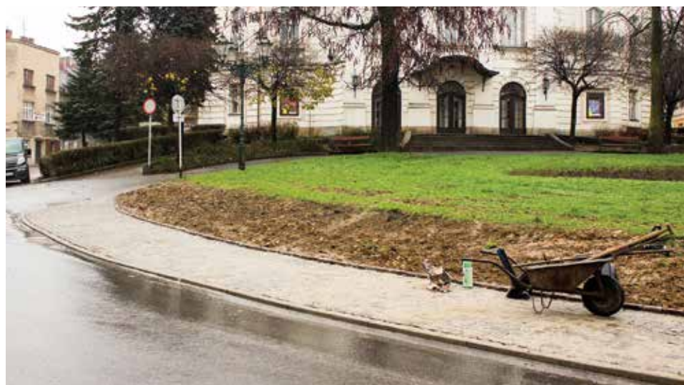
Na placu Teatralnym odnawiany jest właśnie chodnik.