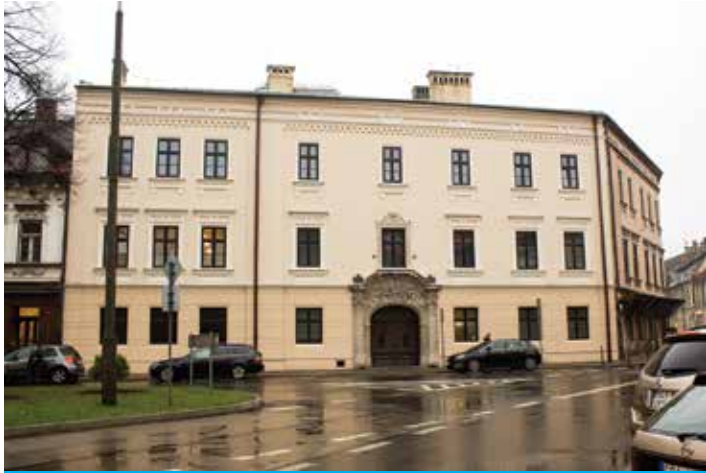
Kamienice w Cieszynie odzyskują blask – fasada klasztoru SS. Boromeuszek.