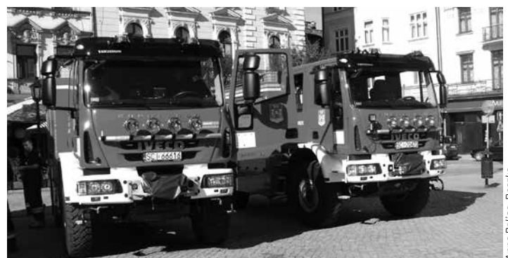
Samochody zakupione w ramach projektu.

mieszkańcy tych miejscowości mieli możliwość obejrzenia zakupionego sprzętu. Wartość sprzętu zakupionego dla OSP w Cieszynie wyniosła 1 379 808 zł.